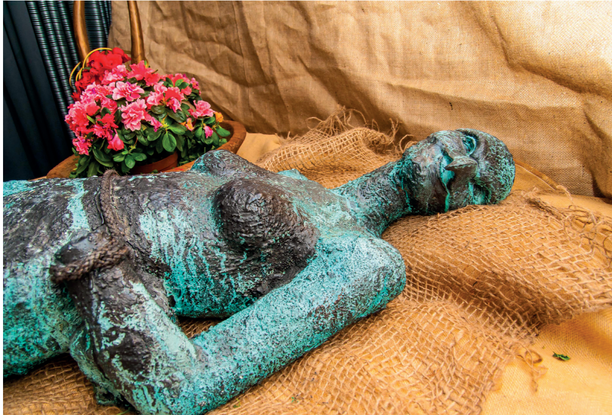
"Mujer pájaro" Escultura pieza única. 2018