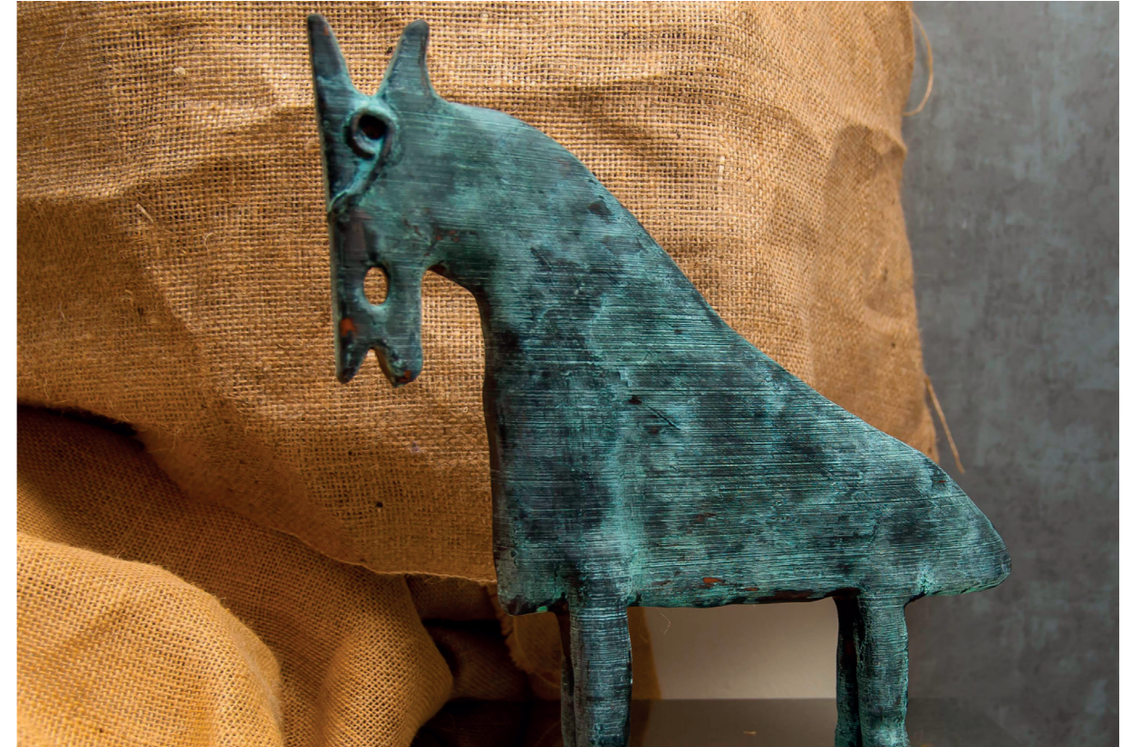
Escultura plástico termoconformable. Ed.4/10. 2018