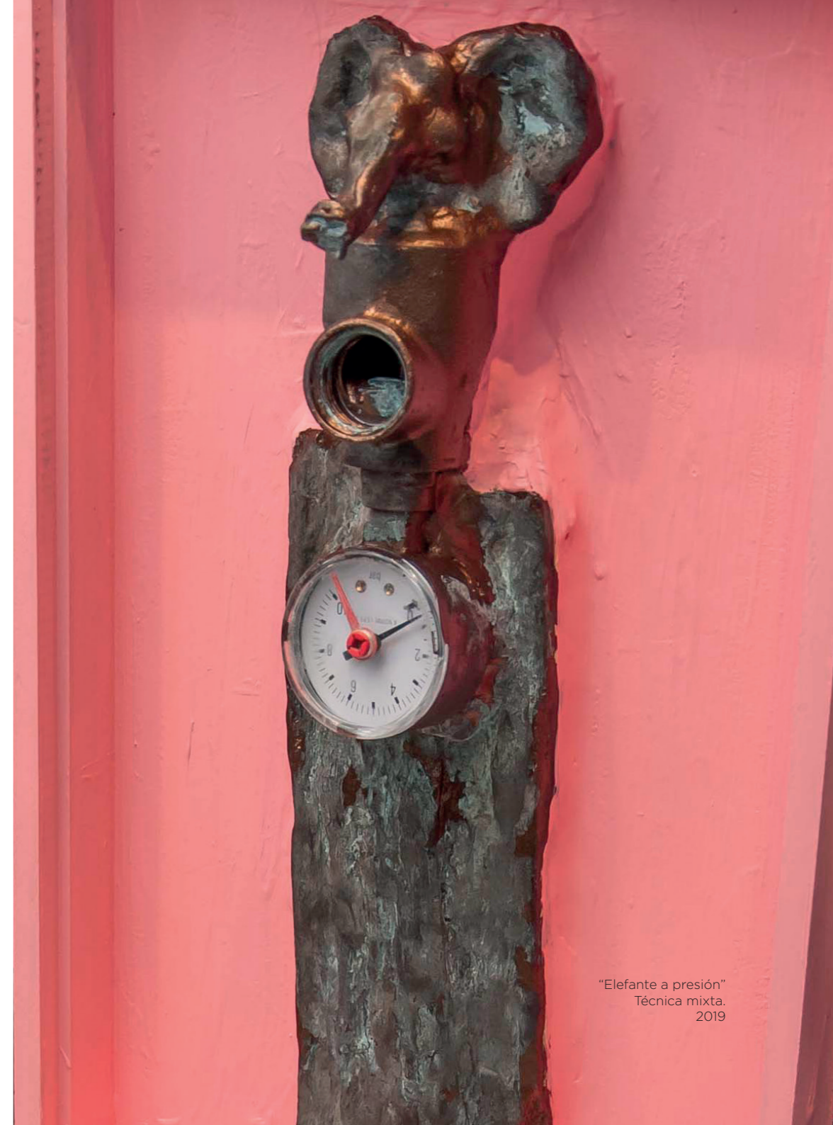
"Elefante a presión" Técnica mixta. 2019