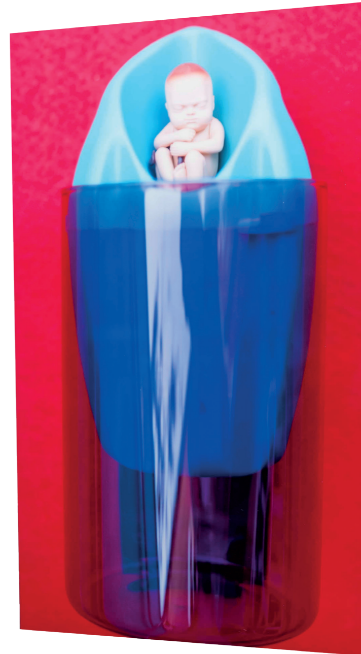
Fotoescultura sobre dibond. Ed 1/5. 2018

Un viaje a través del arte integrativo y experimental