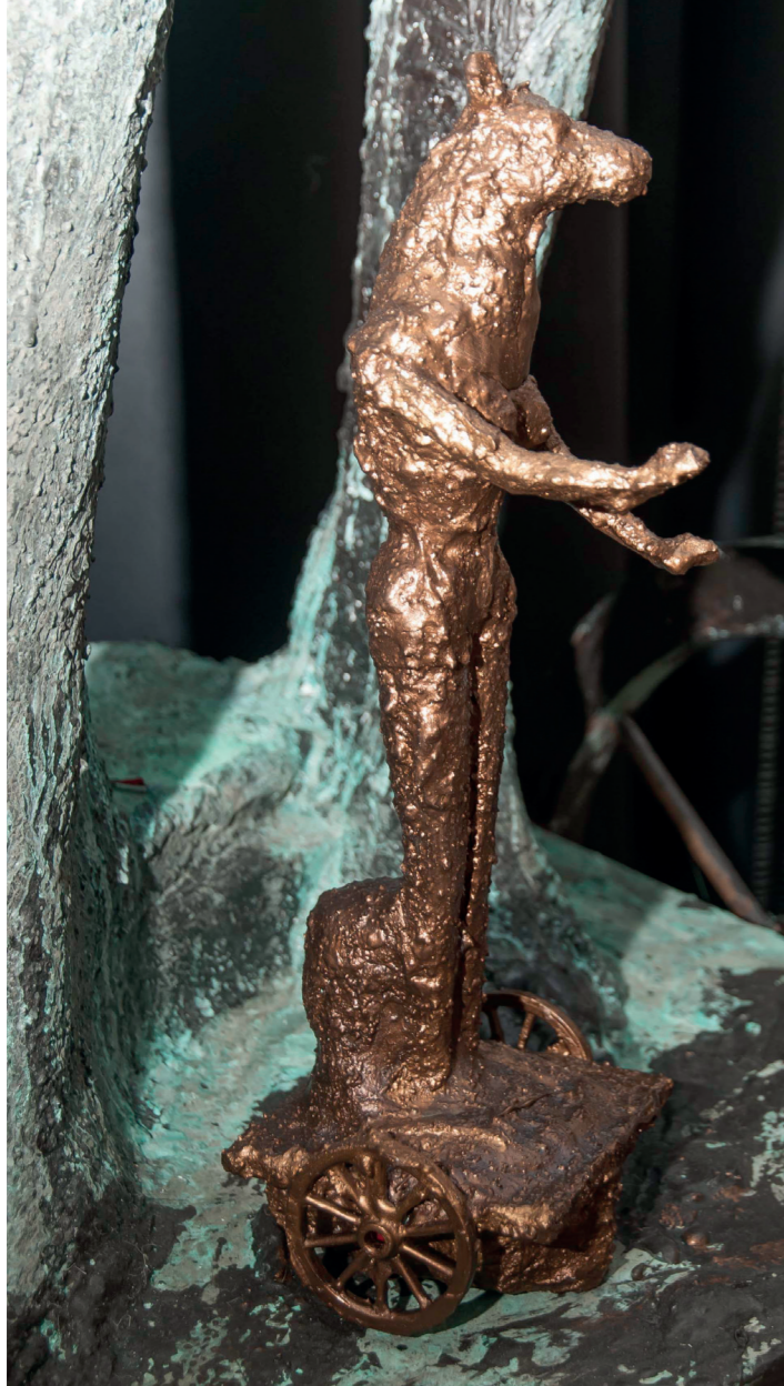
"Amazona miniatura" Escultura técnica mixta ed 1/10. 2019