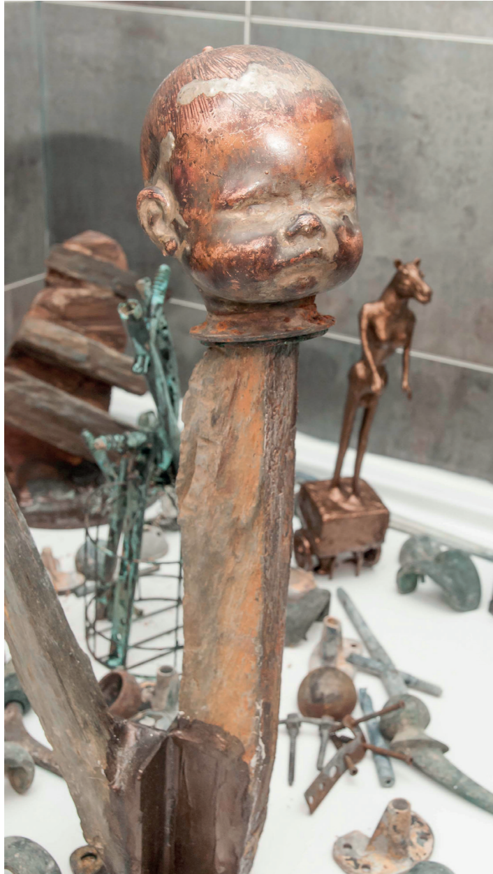
Instalación ACUMULACION-REPETICION-MUESTREO. 2019