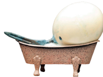
PORTADA "Huevo de avestruz y prótesis de cadera humana tomando un baño de espuma" Fotoescultura 1/5 dimensiones y soportes variables. 2019

Estamos convirtiendo este hermoso planeta en una inmensa patera en la que como especie, navegamos a la deriva en busca de una supervivencia cada vez mas improbable.