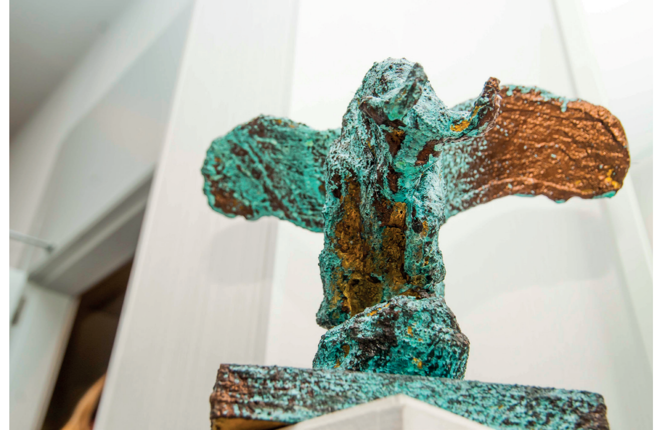
"Toro alado" Escultura ed 1/5. 2019