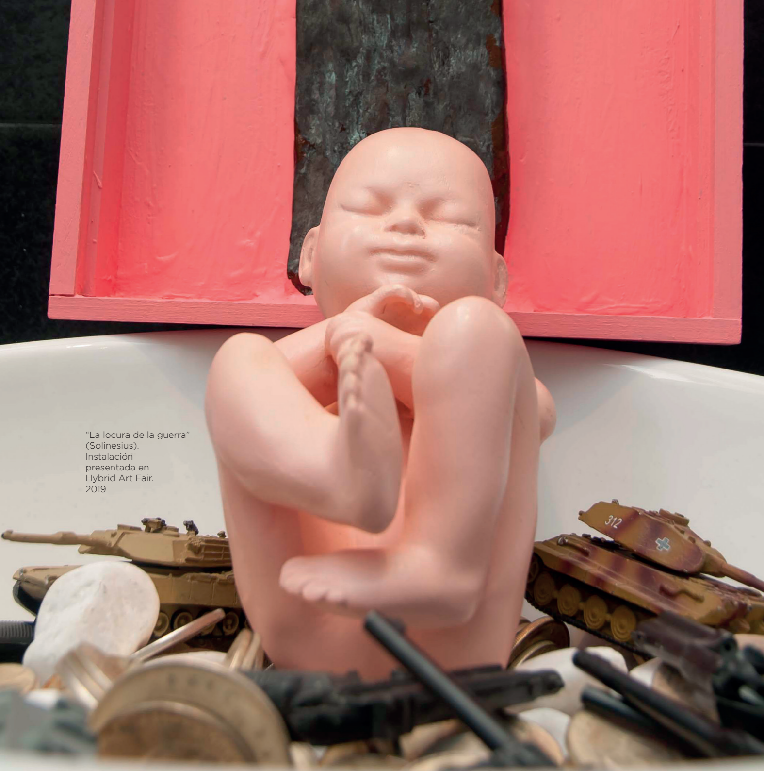
"La locura de la guerra" (Solinesius). Instalación presentada en Hybrid Art Fair. 2019