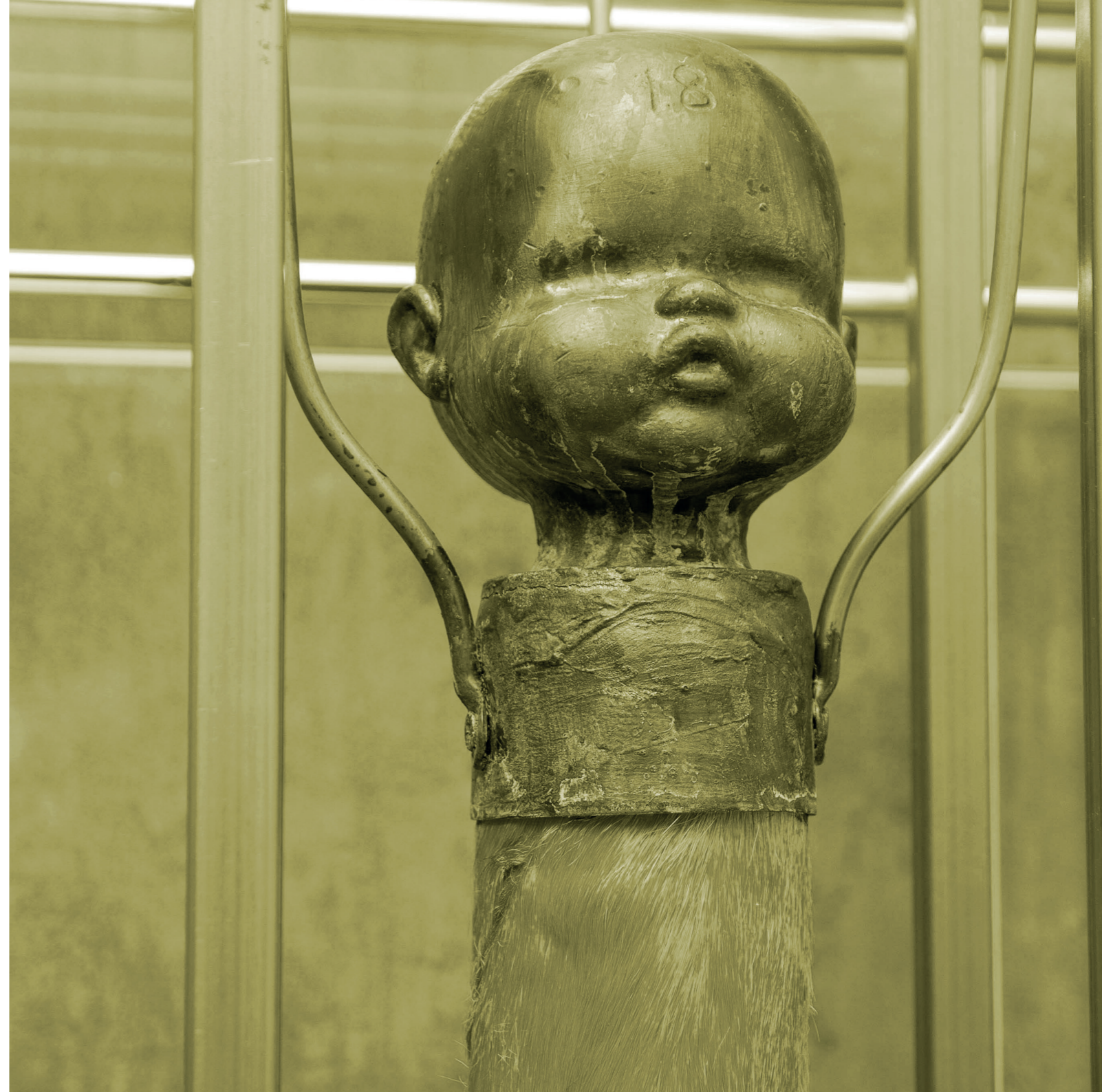
"Bebé pata de vaca" Escultura bronce, hierro, epoxy y material taxidérmico. Pieza única. 2019