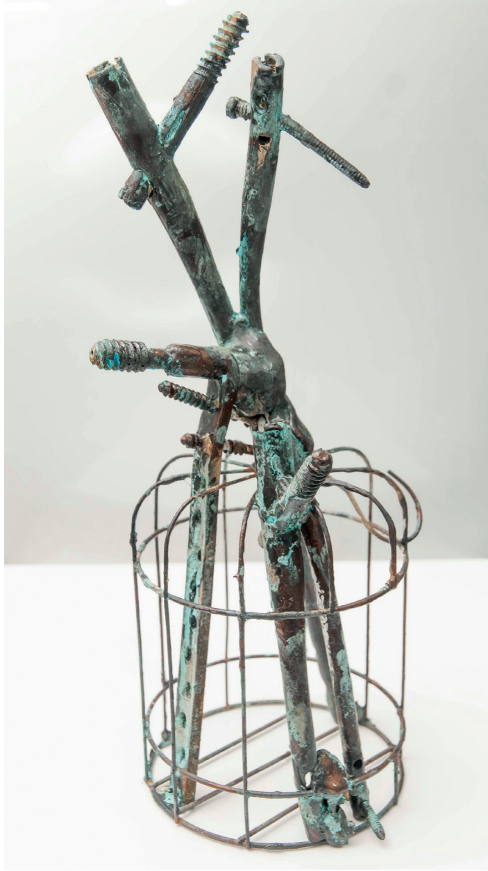
Escultura. Prótesis de cadera humana reutilizada, hierro y epoxi. Pieza única. 2019