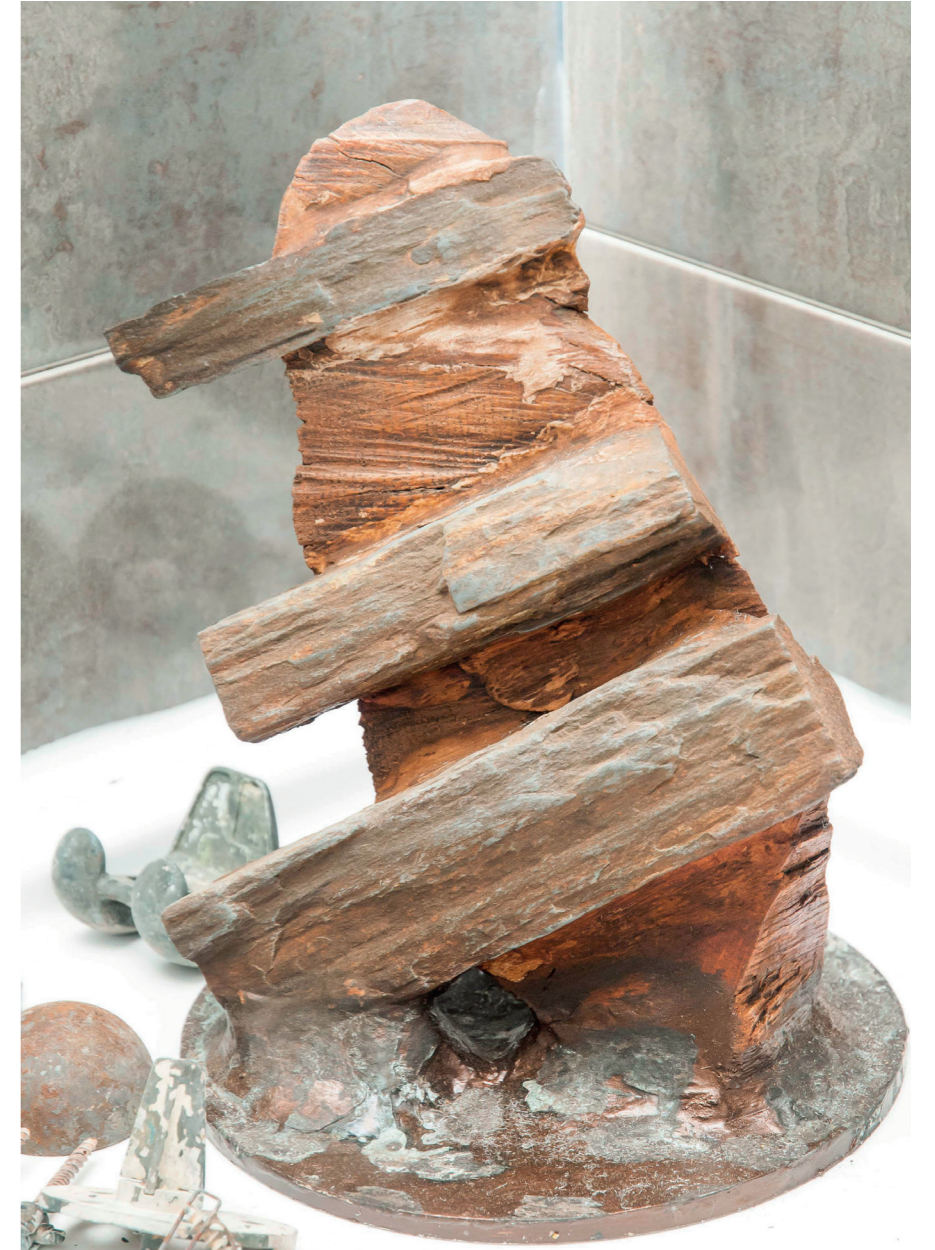
Escultura. Técnica mixta aluminio, madera y pizarra. 2019